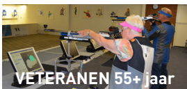
VETERANEN 55+ jaar

Senioren tussen de 21 en 55 jaar schieten vrijstaand met een luchtgeweer of -pistool. Ook mensen met een beperking kunnen de schietsport beoefenen.