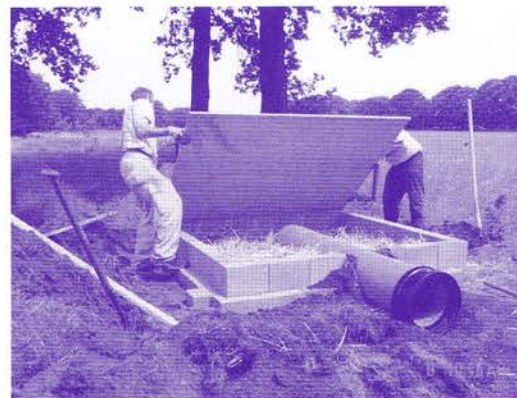
Nieuwe dassenkamer burcht Belfeld

Door over het gehele tracé te werken met eenzelfde type geluidsscherm en ook het wegmeubilair uniform uit te voeren zal er een heel herkenbaar en rustig wegbeeld ontstaan.