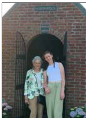
oudste en jongste bewoner