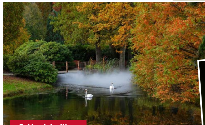
2. Henk Luijten