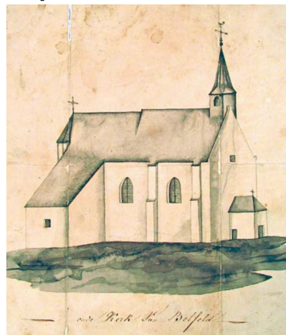
tekening oude kerk Belfeld

krijgt. Na het midden van de zestiende eeuw is er in de bronnen voor het eerst sprake van een zelfstandige bestuurlijke gemeente (kerspel) Belfeld en Geloo. Aanvankelijk wordt dat jonge kerspel steevast als 'Belvet ende Loe' aangegeven. Maar helaas voor Geloo, dat aanzienlijk groter in omvang is dan Belfeld, wordt de gemeentenaam al snel daarna verkort tot alleen 'Belfeld'. De vorming van een eigen dorpsgemeenschap krijgt definitief gestalte als de kapel in 1571 tot parochiekerk wordt verheven. Op religieus gebied weten de Belfeldenaren zich op die manier los te weken van Tegelen.