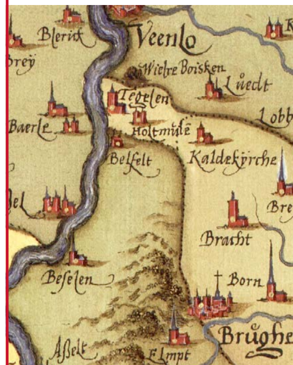
Belfeld Sgroten 1573

Dat Belfeld rond deze tijd voor het eerst op landkaarten verschijnt is geen toeval. De Belfeldse kapel wordt namelijk in 1571 tot parochiekerk verheven. Voor kaartmakers reden genoeg om Belfeld niet langer over te slaan, maar het nieuwe kerkdorp letterlijk een plekje op de kaart te geven.