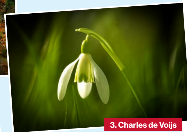
3. Charles de Voijs